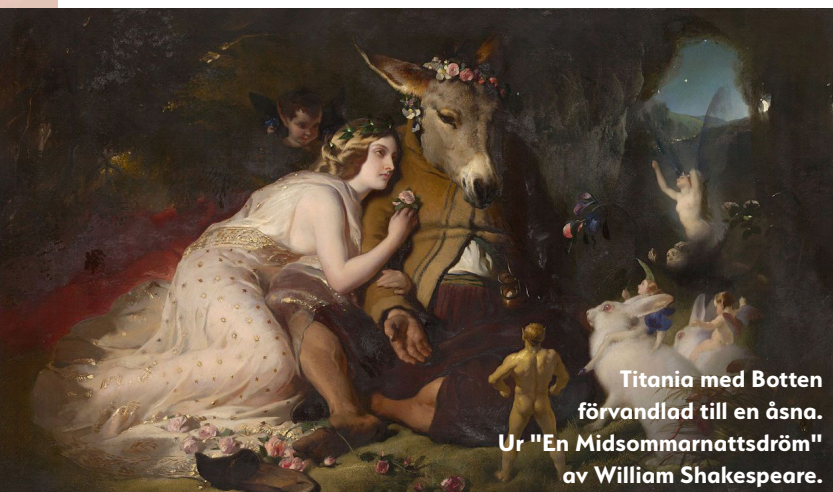
Titania med Botten förvandlad till en åsna. Ur "En Midsommarnattsdröm" av William Shakespeare.