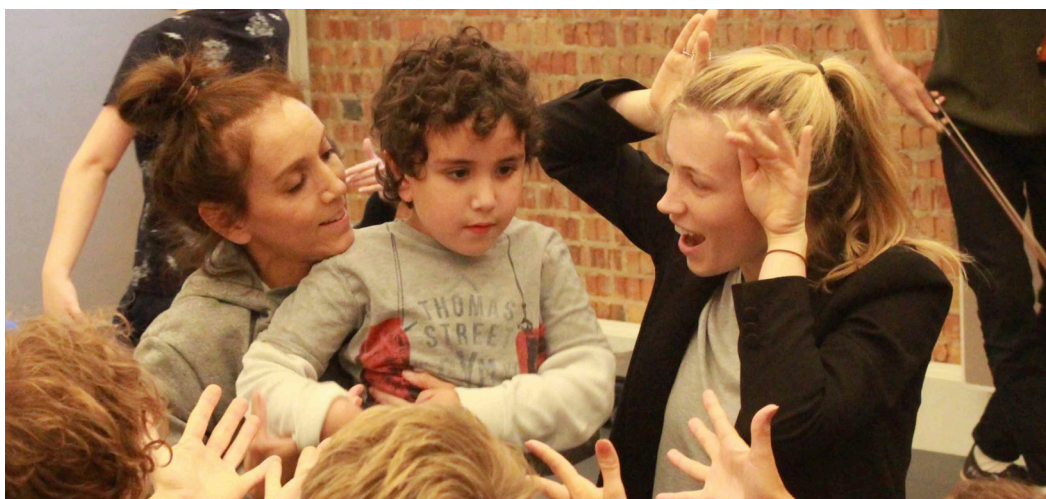
The Hunter Heartbeat Method hos teaterensemblen Flute Theatre, UK.