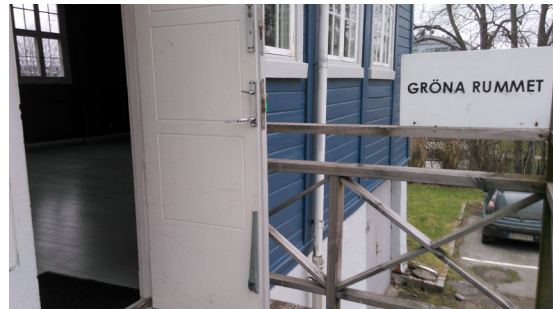
Dörren in till Gröna Rummet (ingången längst bort)